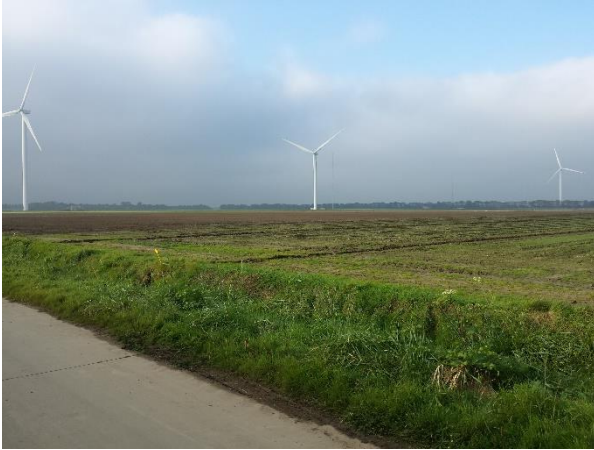
ECN testpark Wieringermeer

Daarna hebben we gezamenlijk een lunch genoten en de ervaringen/indrukken gedeeld. De deelnemers waren positief over de hoogte, wat vooral belangrijk was is de rotor. Als de rotor groter is dan draait ze rustig, dat geeft een mooi beeld. Ook over het geluid was men positief, dit viel heel erg mee op een afstand van 600 meter. De meeste woningen van WP Waardpolder staan nog veel verder van de molens, ongeveer 800 meter.