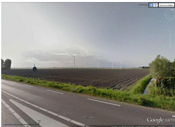
Visualisatie nieuwe windmolens vanaf kruispunt Kolhorn

De 3 e bijeenkomst op 17 september 2015 heeft inzicht gegeven in de onderzoeken die WP Energiek heeft uitgevoerd over o.a.: geluid, slagschaduw, ecologie, externe veiligheid, bodem en water, landschappelijke inpassing, defensie en radar, obstakelverlichting etc.